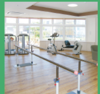
機能訓練スペース