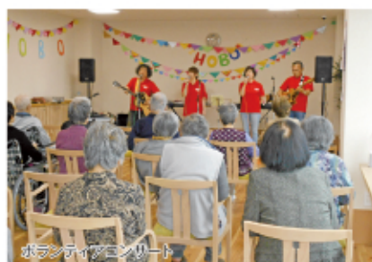
ボランティアコンサート