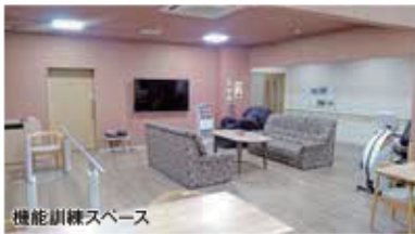
機能訓練スペース