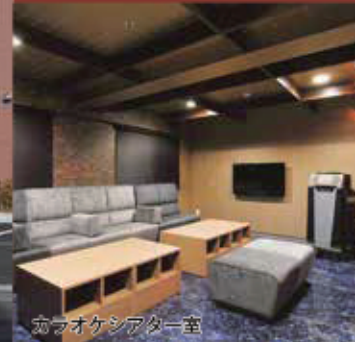
カフェ・ラウンジ

〒065-0020 北海道札幌市東区北20条東1丁目4番1号 TEL:011-731-1294 FAX:011-722-0295