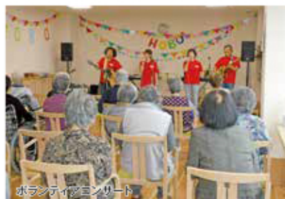
ボランティアコンサート