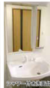
シャワー付洗面台