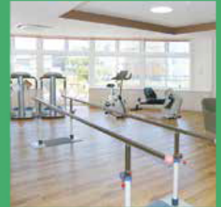
機能訓練スペース